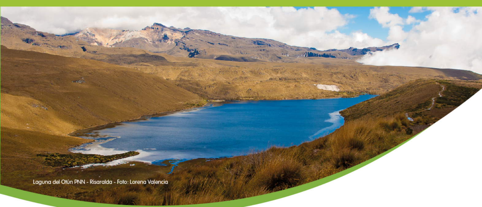
Laguna del Otún PNN - Risaralda